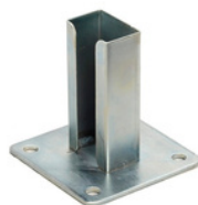
Pie metálico 60x40